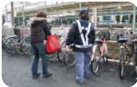
制服を着た自転車指導員が誘導します

自転車指導員が駅周辺の自転車放置禁止区域に立ち、自転車駐車場への誘導や放置防止を呼びかけます。