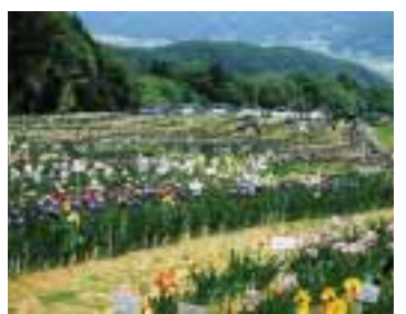
信州アイリス祭り

☎往復はがき。ツアー名、参加者全員の住所、氏名、年齢、性別、代表者の電話番号、かの別を明記。区民生活課施設予約係(〒144-8621大田区役所)へ。4月6日必着